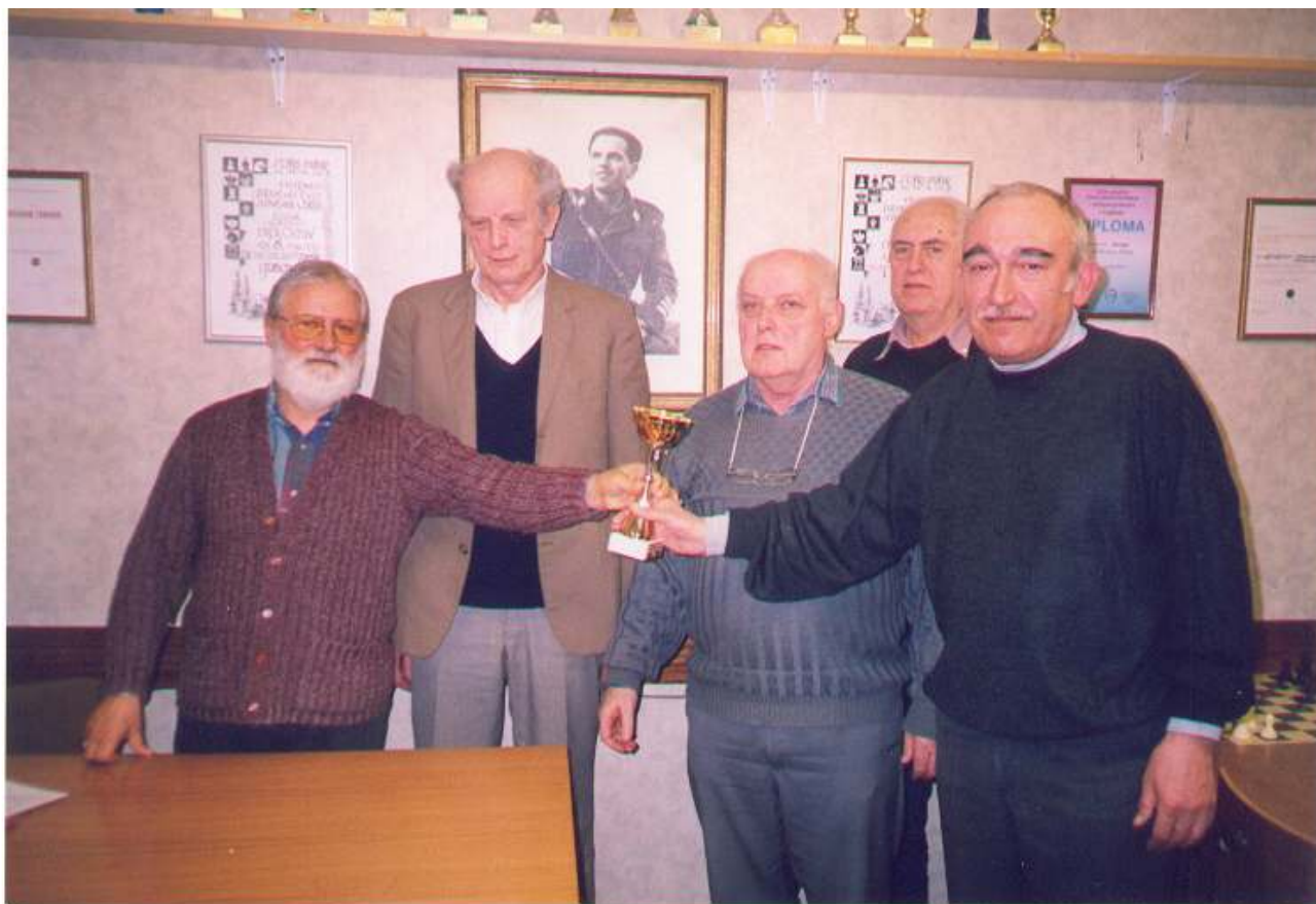
Zmagovalna ekipa LŠK upokojenci.

Ker pa se je ekipa LŠK upokojenci odpovedala nastopu na državnem pokalnem prvenstvu, se na državno pokalno prvenstvo uvrsti drugo uvrščena ekipa ŠK Komenda I.